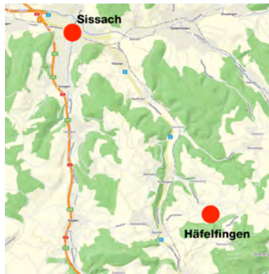
Oberbaselbiet | Homburgertal