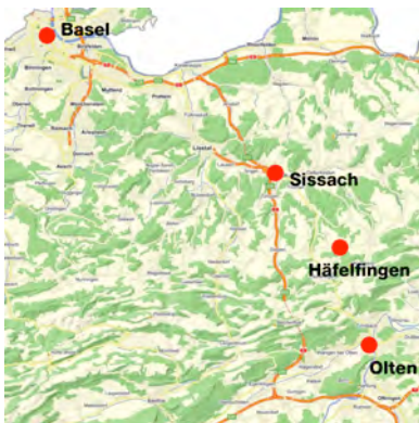
Nordwestschweiz | Baselbiet

Direkte Schnellzüge nach Basel, Bern und Zürich verkehren regelmässig ab Sissach.